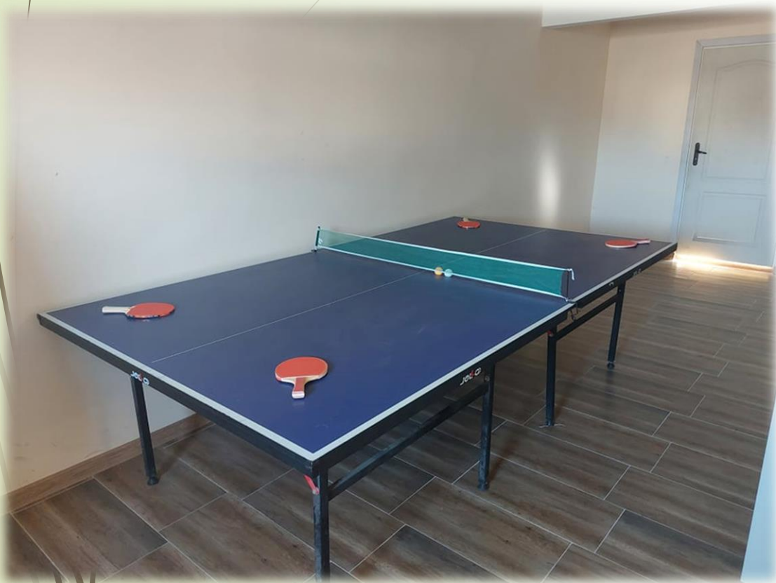
► Физкултурен салон